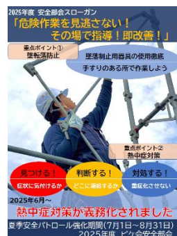
安全パトロールポスター